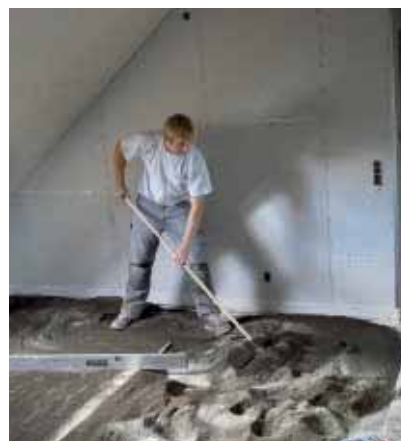
Opretning af bjælkelag med Leca® 0-4 mm