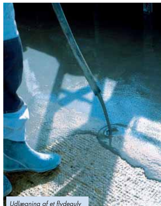
Udlægning af et flydegulv