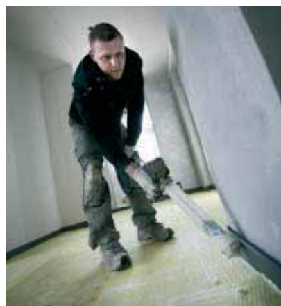
Kantisolering ved et maxit lyd gulv er en vigtig del af gulvkonstruktionen