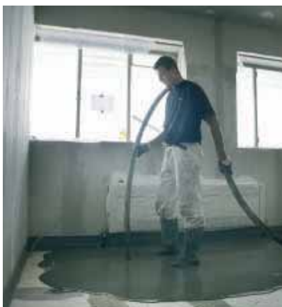
Udlægning af et maxit flydegulv

Høj kvalitet og professionel udlægning er nøgleordene. Gulvet færdiggøres hurtigt og effektivt og via vores fastlagte kvalitetsprocedurer med sikkerhed for et godt resultat. Via vores CmG'er får du som kunde den bedste og mest professionelle udførelse, dvs. ingen ærgrelser.